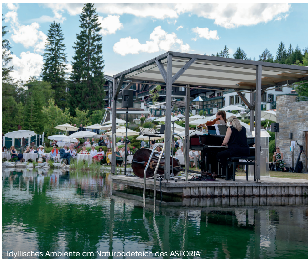
Idyllisches Ambiente am Naturbadeteich des ASTORIA