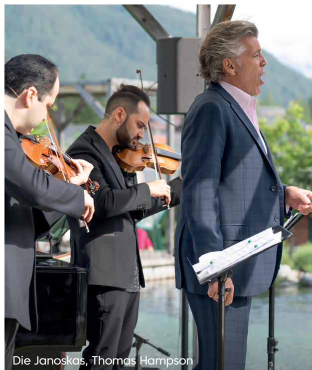
Die Janoskas, Thomas Hampson